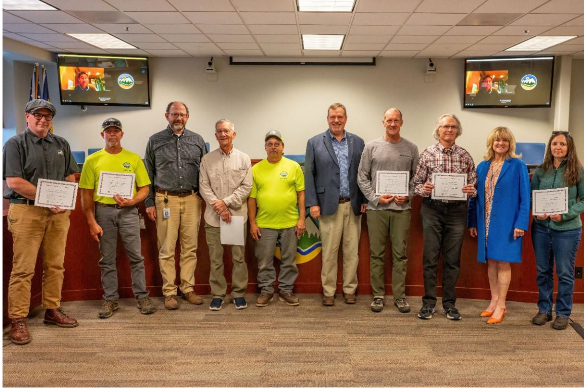
Ganadores de los premios de aceras seguras de 2024 con el comisionado del condado Tony Debone (quinto desde la derecha) y la comisionada presidenta del condado Patti Adair (segunda desde la derecha)

El miércoles 29 de mayo, la Junta de Comisionados del condado de Deschutes reconoció a los ganadores de los premios de aceras seguras de 2024, un premio anual que se otorga a las empresas y personas que ayudan a mantener las aceras públicas limpias para los peatones.