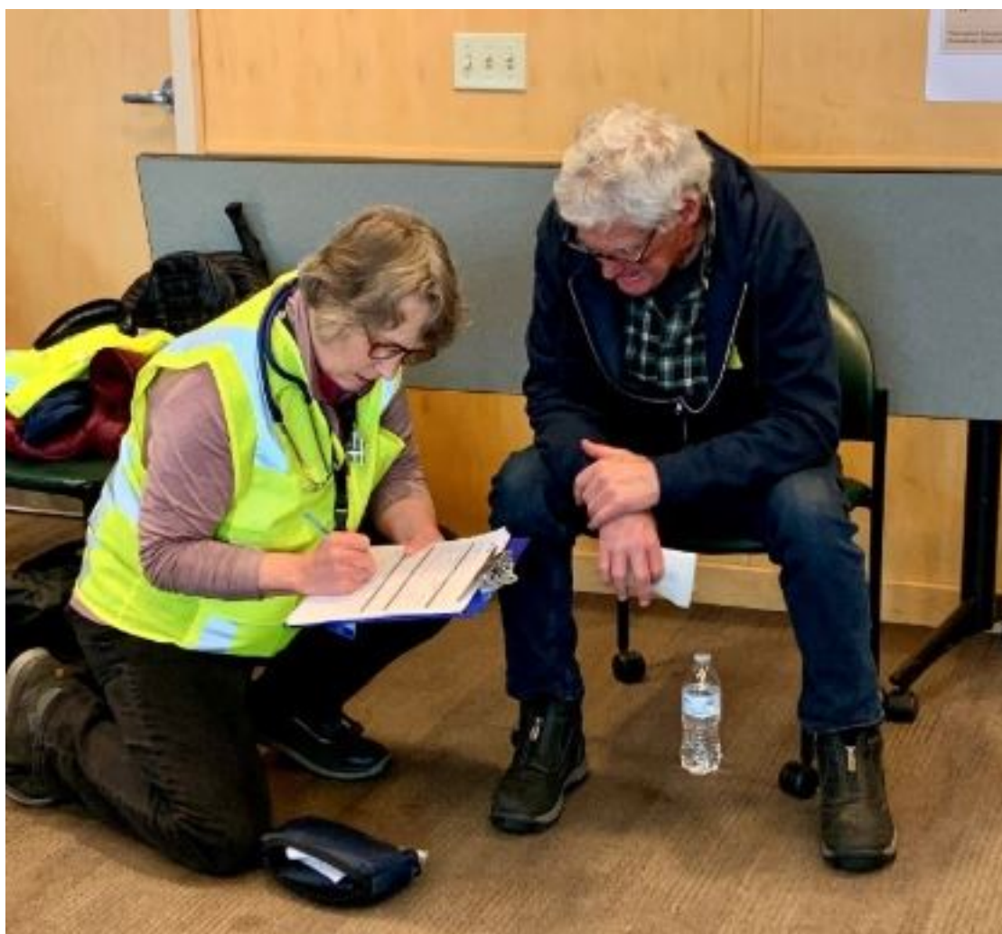
Voluntario médico de DCMRC evaluando a un "huésped del refugio" y sus necesidades médicas.