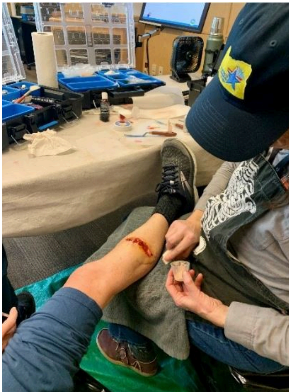
El voluntario de DCMRC aplica una herida de moulage a un actor de rol.

Cuando ocurre un desastre, la preparación puede marcar la diferencia. Por eso, el Cuerpo de Reserva Médica del Condado de Deschutes (DCMRC, por sus siglas en inglés), en colaboración con la Cruz Roja y la Autoridad de Salud de Oregon, llevó a cabo un ejercicio de preparación ante